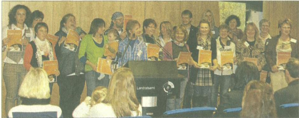
27 Mütter, ein Vater und ein Landrat: Nach den vorgeschriebenen 160 Unterrichtseinheiten halten die Kursteilnehmer jetzt ihre Zertifikate in Händen.